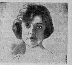
Con referencia a la boda de la Princesa Mafalda, que se celebrará hacia el 15 de Setiembre próximo, la ceremonia nupcial no se verificará en Raiconigi, como se dijo en un principio, sino en Santa Ana Valdierti, en el Castillo Real del Piemonte.